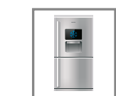
Réfrigérateur, Congélateur Générateur de froid défaillant