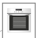
Four Panne de la résistance