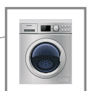
Lave-linge Panne du tableau de commande